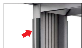
セイフティガードA