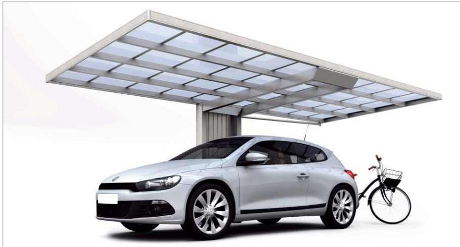
アルミタイプ (ステン カラー・2860サイズ)